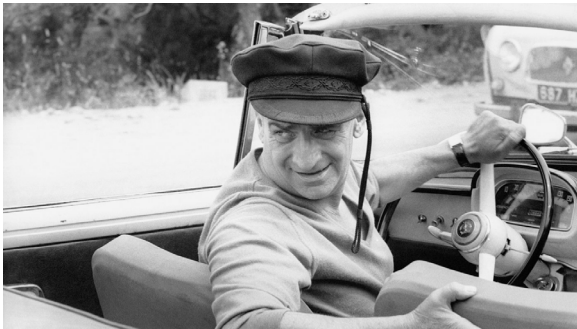
Le Gendarme se marie

Le visiteur redécouvre ensuite le modèle le plus emblématique du cinéma de Louis de Funès : la Citroën Méhari de la série des Gendarmes , qui a acquis une notoriété au-delà de nos frontières grâce au succès de la saga. En 1964, Le Gendarme de Saint-Tropez a réuni plus de 8 millions de spectateurs dans le monde !