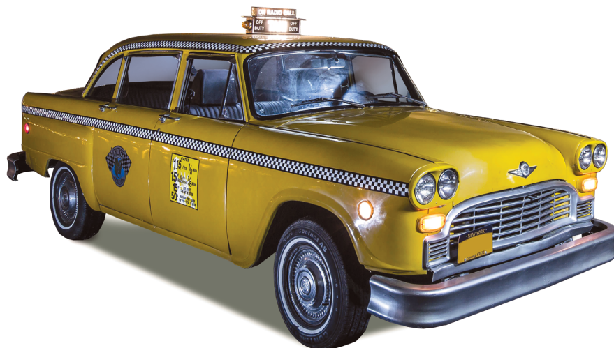
Taxi Yellow Cab 1979

Louis de Funès est le héros d'un vrai film d'aventures au tempo américain : une course-poursuite avec une heure quarante pleine de quiproquos et de rebondissements qui débute à New York, dans la communauté hassidique de Brooklyn, se poursuit sur la route entre Deauville et Paris dans une DS surmontée d'une barque, passe par le café des Deux Magots et une usine de chewing-gum pour s'envoler sur le pavé de la rue des Rosiers et finir avec un hélicoptère.