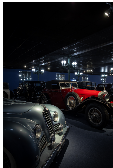
Vues des collections permanentes