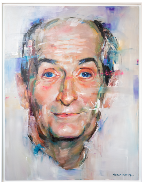
Meja pour le Musée Louis de Funès

Près de 20 véhicules sont exposés dont quatre modèles originaux ayant servi lors des tournages du Corniaud (la 2 CV démantibulée et une Cadillac) et des Gendarmes (une Ford Mustang et une Oldsmobile). Autour de ces immanquables, le public découvre dans sa déambulation des affiches de films, des photos de tournage, des objets tels que le chapeau original de Rabbi Jacob , des tenues faisant référence aux films ou encore des dioramas représentant certaines des scènes les plus connues de Louis de Funès au volant. Des documents originaux de la vie privée de l'acteur, dont le certificat d'immatriculation de sa Renault R1181, sont également exposés.