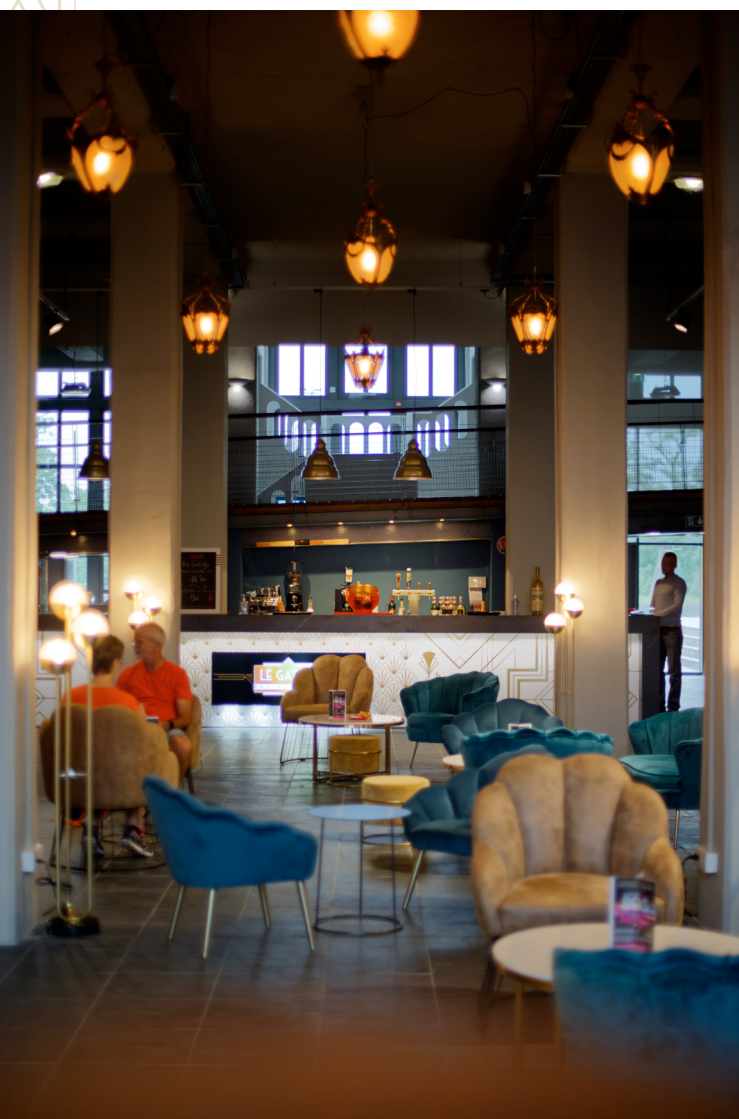
Le Gatsby Bar

Le Musée National de l'Automobile – Collection Schlumpf est le premier musée de ce type à avoir créé un équipement qui rompt délibérément avec l'image statique d'une collection exposée. Les voitures reprennent leur mouvement pour le plaisir des visiteurs et des collectionneurs.