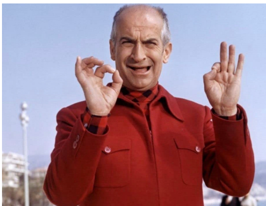
Louis de Funès dans L'Homme orchestre de Serge Korber

La visite se poursuit avec Les Aventures de Rabbi Jacob , film devenu mythique, entre autres, pour sa célèbre réplique « Salomon, vous êtes juif ? » lancée par Louis de Funès à son chauffeur dans une scène tout aussi célèbre.