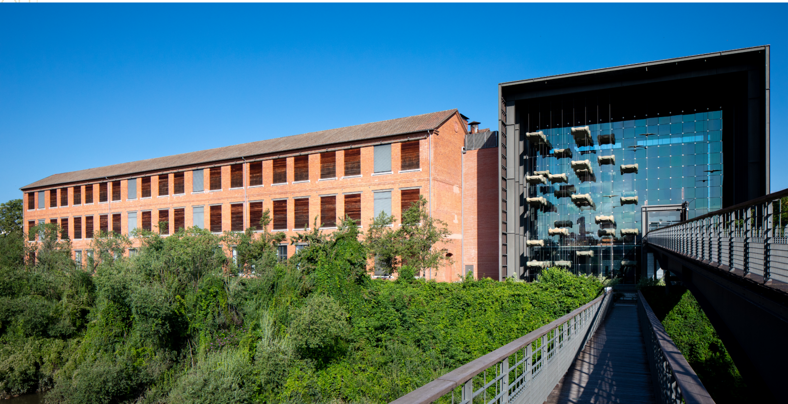
Vue de l'entrée du musée