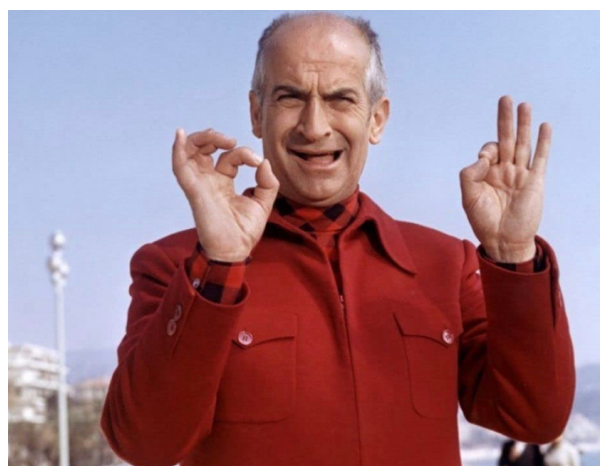
Louis de Funès dans L'Homme orchestre de Serge Korber

Quand Louis de Funès défie une Lamborghini Miura... Dès le générique du film, l'acteur français, au volant d'une Fiat 124 Coupé, affronte aux feux rouges des Ford Mustang, Alfa Romeo Giulia et autres voitures sportives de l'époque. Vient alors une Miura couleur Giallo qui vient le déchoir de son statut de meilleur starter. La suite est hilarante ! Louis de Funès et sa Fiat 124 Coupé rouge ne comptent pas se laisser faire par une Lamborghini sur les hauteurs de Nice jusqu'à la Promenade des Anglais.