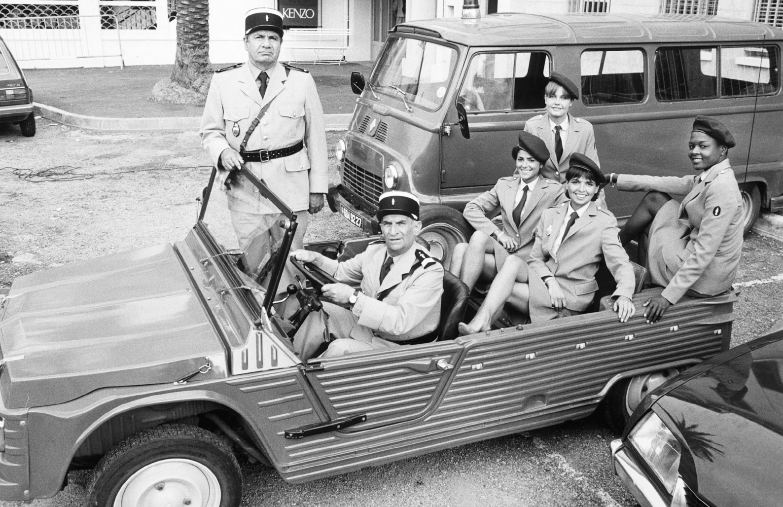
Le Gendarme et les Gendarmettes