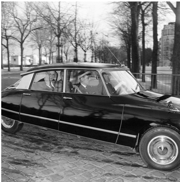
Charles de Gaulle dans la DS présidentielle

Production Gaumont (France) / Da. Ma. Produzione (Italie), 1965. Collection Gaumont.