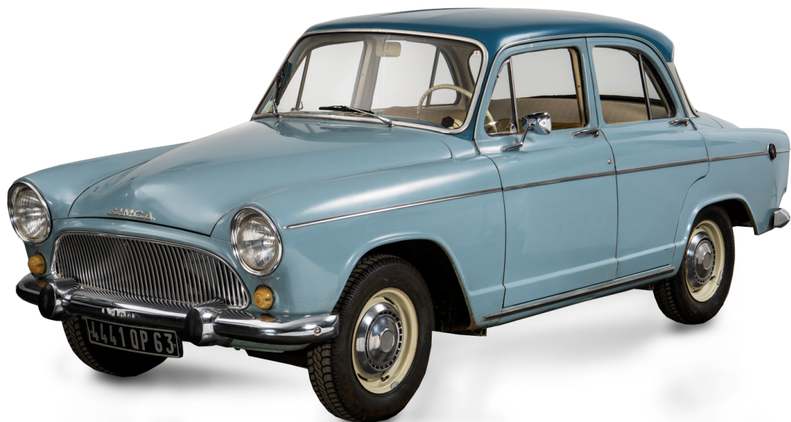
Simca Aronde Élysée 1961

Dans une autre scène, Louis de Funès s'improvise livreur de charbon. Bien décidé à livrer tous les sacs de charbon à un rythme effréné, il enchaîne les virages nerveusement au volant d'une Renault Galion, un camion léger peu adaptée aux conduites « sportives », donnant des sueurs froides à son passager.