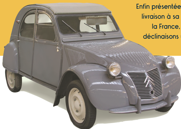
Citroën 2 CV 1954

Enfin présentée au grand public le 7 octobre 1948, elle devient incontournable et les délais de livraison à sa sortie sont annoncés avec un délai d'attente de sept ans. Incarnant tour à tour la France, une époque mais aussi un état d'esprit, une philosophie, elle devient au fil des déclinaisons une véritable icône de cinéma : Le Gendarme de Saint-Tropez , Le Gendarme et les Gendarmettes , Rien que pour vos yeux... et bien sûr Le Corniaud .