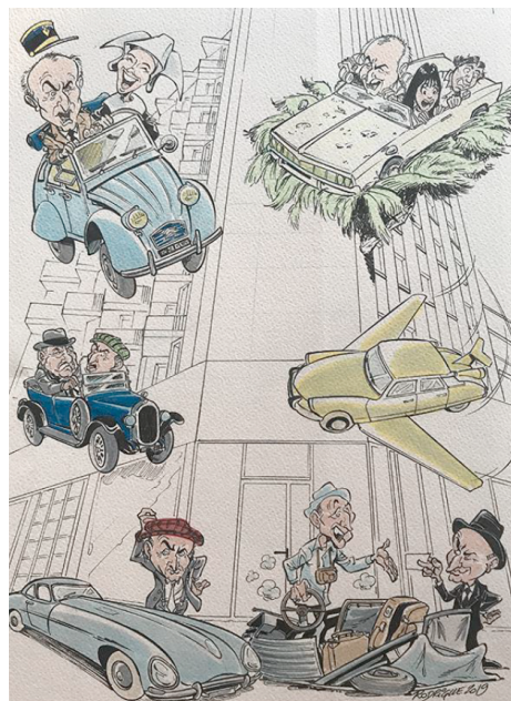
Rayclame pour le Musée Louis de Funès

La filmographie de Louis de Funès a très souvent épousé les modes liées à un contexte social, culturel, économique ou politique. L'histoire de l'Automobile du 20 ème siècle n'y échappe pas. La 2 CV du Corniaud , la DS d' Hibernatus et de Rabbi Jacob , la Méhari des Gendarmes ... Dans ces films, les voitures emblématiques des années 60 et 70 sont des personnages à part entière qui ont marqué l'imaginaire de toute une génération de spectateurs !