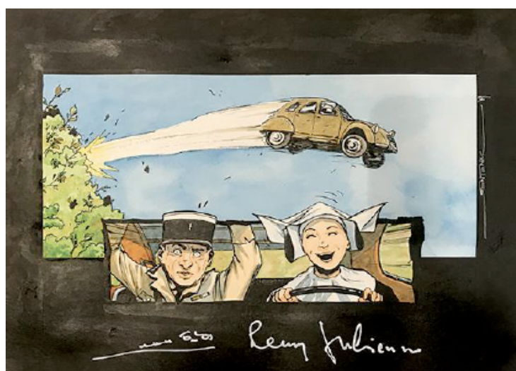
Rayclame pour le Musée Louis de Funès

Au fil de ses 46 ans de carrière, le « Einstein des cascades » a collaboré avec les plus grands noms du 7 ème Art, de Sergio Leone à Gérard Oury en passant par Dino Risi, Claude Lelouch et Sydney Pollack. Son nom est apparu sur plus de 1 400 génériques, dont une dizaine de films de « Bébel » et six volets de la franchise James Bond. Il a aussi doublé à l'écran Al Pacino, Harrison Ford, Charles Bronson, mais aussi Carole Bouquet, Sophia Loren et Gina Lollobrigida.